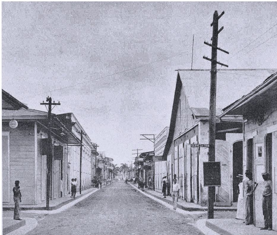
Calle San Francisco esquina Santa Ana, San Francisco de Macorís. Al fondo, la fortaleza, cerca 1935

En contraposición a su puntual producción intelectual, su genealogía revela una amplia variedad de